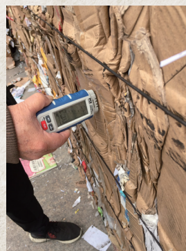
▲ 正進行廢紙水份檢測