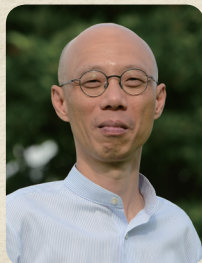
香港特別行政區政府 環境局局長