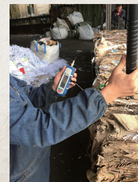
▲ 正進行廢紙水份檢測