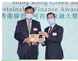
中國銀行(香港)有限公司