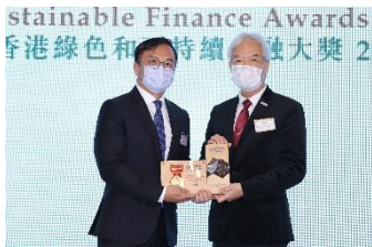
現代貨箱碼頭有限公司