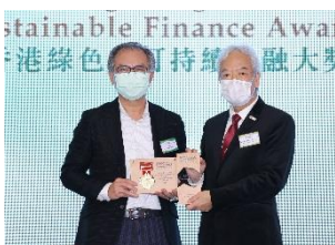
利奧紙品集團財務有限公司