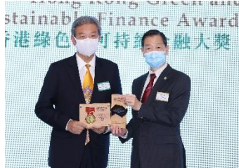
安樂工程集團有限公司