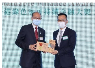
維達國際控股有限公司