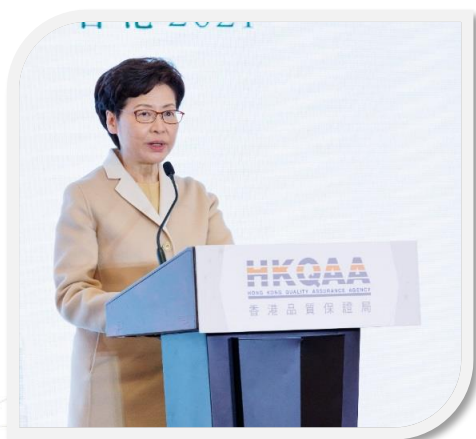
香港特別行政區行政長官林鄭月娥女士擔任主禮嘉賓。

香港品質保證局於2021年12月3日假港島香格里拉酒店，舉行香港品質保證局專題研討會2021，並邀得香港特別行政區行政長官林鄭月娥女士擔任主禮嘉賓；以及財經事務及庫務局局長許正宇先生、環境局副局長謝展寰先生擔任特別嘉賓。