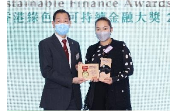
荷蘭合作銀行香港分行