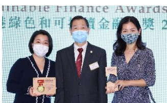
中國國際金融香港證券有限公司