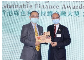
香港光電控股有限公司