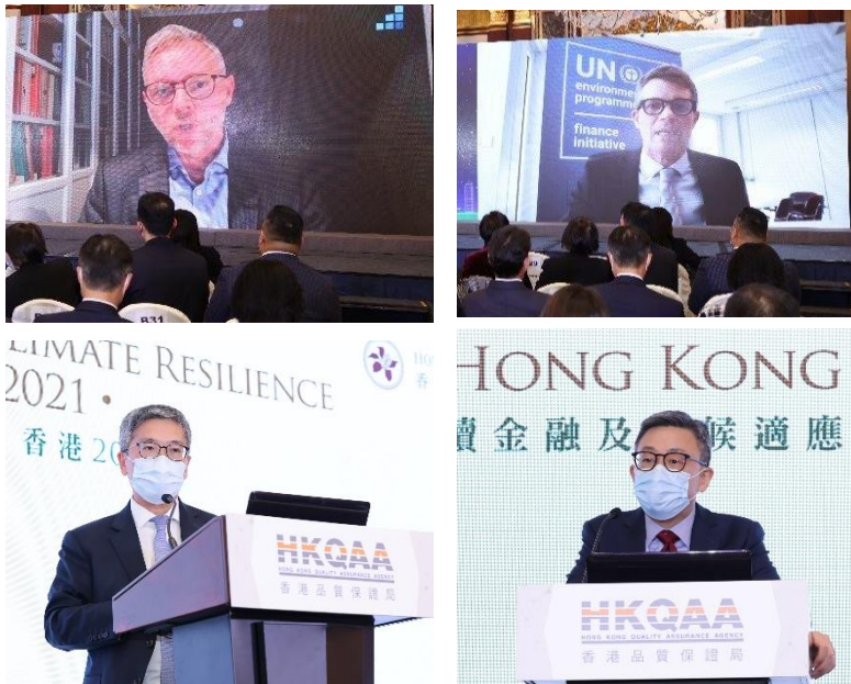
左至右：聯合國環境規劃署金融倡議主管Eric Usher，以及氣候相關財務披露工作小組成員、聯合國責任投資原則理事會主席Martin Skancke 透過視頻致辭、香港金融管理局副總裁阮國恒先生，太平紳士、香港金融發展局行政總監區景麟博士，榮譽勳章在專題研討會上發言