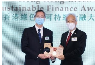
中國船舶（香港）航運租賃有限公司