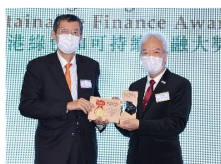
興業銀行股份有限公司香港分行