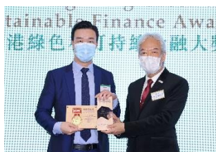
五礦地產有限公司