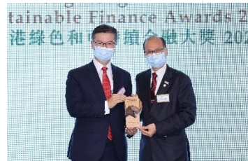
東亞銀行有限公司