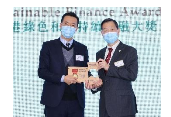
中國燃氣控股有限公司