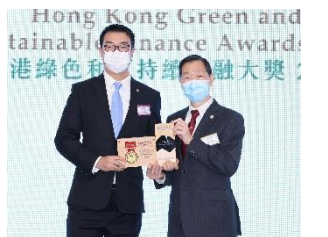
中國光大銀行股份有限公司 香港分行