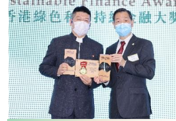
國家開發銀行香港分行