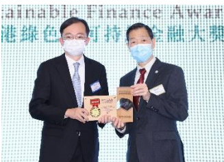
中國光大銀行股份有限公司 香港分行