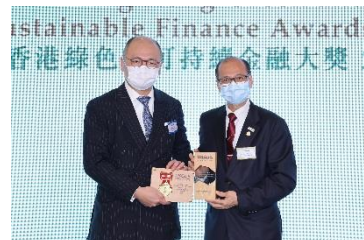
渣打銀行(香港)有限公司