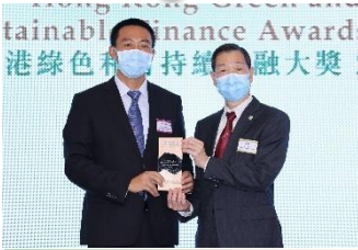
中國農業銀行股份有限公司香港分行