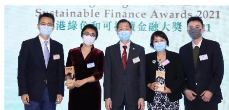
招商銀行股份有限公司