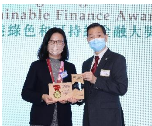
中國銀行(香港)有限公司