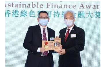
中怡國際集團有限公司