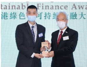
中國工商銀行有限公司