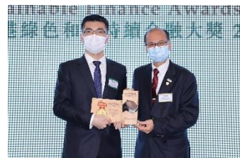
香港雲能國際投資有限公司