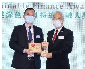
海通國際證券集團有限公司