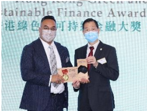
中國旭陽集團有限公司