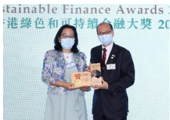
上海浦東發展銀行股份有限公司 香港分行