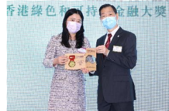
中國銀行(香港)有限公司