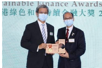
香港鐵路有限公司