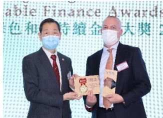
荷蘭合作銀行香港分行