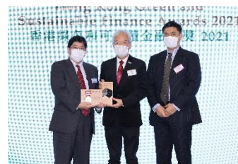
三菱和誠金融（香港）有限公司