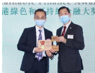
中國建設銀行(亞洲)股份有限公司