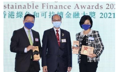
大華銀行有限公司香港分行