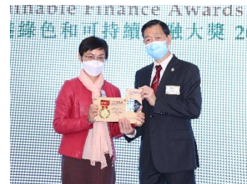
中國建設銀行(亞洲)股份有限公司