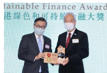
恒基陽光資產管理有限公司