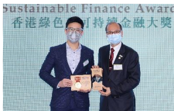
葉氏化工集團有限公司