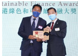
中國建設銀行(亞洲)股份有限公司