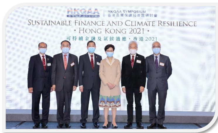
香港特別行政區行政長官林鄭月娥女士（右三）、財經事務及庫務局局長許正宇先生（左二）、環境局副局長謝展寰先生（右一）、香港品質保證局主席何志誠工程師（左三）、副主席黃家和先生（右二）和總裁林寶興博士（左一）在「香港品質保證局專題研討會2021」上合照。