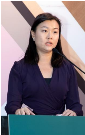
香港特別行政區商務及經濟發展局首席助理秘書長陳雅詠女士於會上致辭。